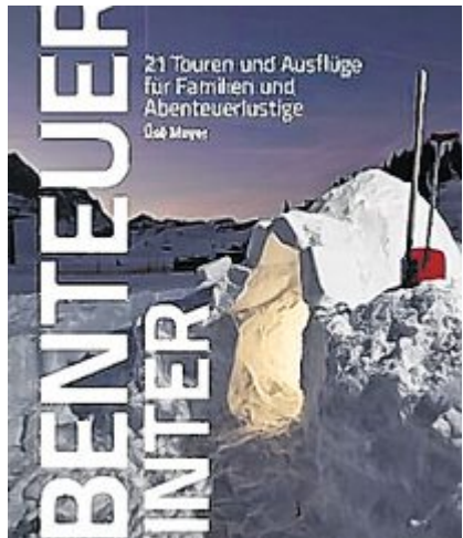
Üsé Meyer, Abenteuer Winter. Winter Verlag 192 S. Fr. 34.90

Quer durch die Schweiz gibt es viele individuelle Outdoor-Vergnügen zu entdecken. Ob anspruchsvolle Skitour, stimmungsvoller Winter Spaziergang, rassige Schlittenfahrt oder Eisklettern am gefrorenen Wasserfall: Eine Fülle an aussergewöhnlichen Vorschlägen verlockt selbst Stubenhocker. Sportlichen Ambitionen sind kaum Grenzen gesetzt. Üsé Meyers Tourenvorschläge führen auch zu «Tatorten», die aus Film, Literatur und Musik bekannt sind. Das Buch ist mit hervorragenden Farbfotos illustriert und mit Karten und allen nötigen Informationen ergänzt.