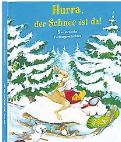
5 winterliche Vorlesegeschichten Nord Süd 144 S. Fr. 19.90.

Die fünf Geschichten sind als Bilderbücher bereits einzeln erschienen und liegen nun als preisgünstiger Sammelband vor. Sie erzählen vom kleinen Eisbär, der einen Angsthäsen rettet, vom Waisenmädchen Lumina, das auf einem Bauernhof ein neues Zuhause findet, von Filo, dem kleinen Hund, der im Schnee herumtollt und sich dabei verirrt. Die Abenteuer von Schneeflocke stimmen auf den Winter ein und im Märchen von Alina und Aluna spielen die Jahreshüter mit den Monatsbrüdern eine Rolle. Das schön gestaltete Bilderbuch wird die Kinderherzen erfreuen.