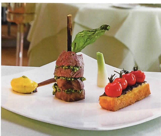
Fleischgericht aus dem «Sources Des Alpes».