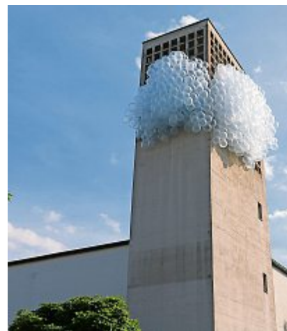
Die Atemwolke in Gerliswil.

Entworfen wurde das Design vom Künstler Micha Aregger. Die Ballons wurden von den Mitgliedern der verschiedenen Gemeinden aufgeblasen. Zum Auftakt hängt die Installation am Turm der Kirche in Gerliswil. Weitere Aufenthaltsstationen sind Kirchen in Weggis, Horw, Ebikon, Sursee, Kriens, Buchrain - Root