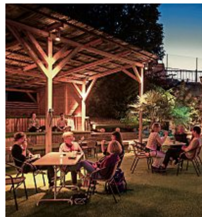
Im Sommer lädt die Schüür zum Entspannen in den Garten ein.