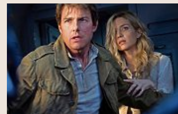
Tom Cruise und Annabelle Wallis sehen sich mit einer uralten Mumie konfrontiert.