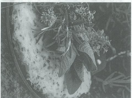
Ornette obwaldienne aux fines herbes.