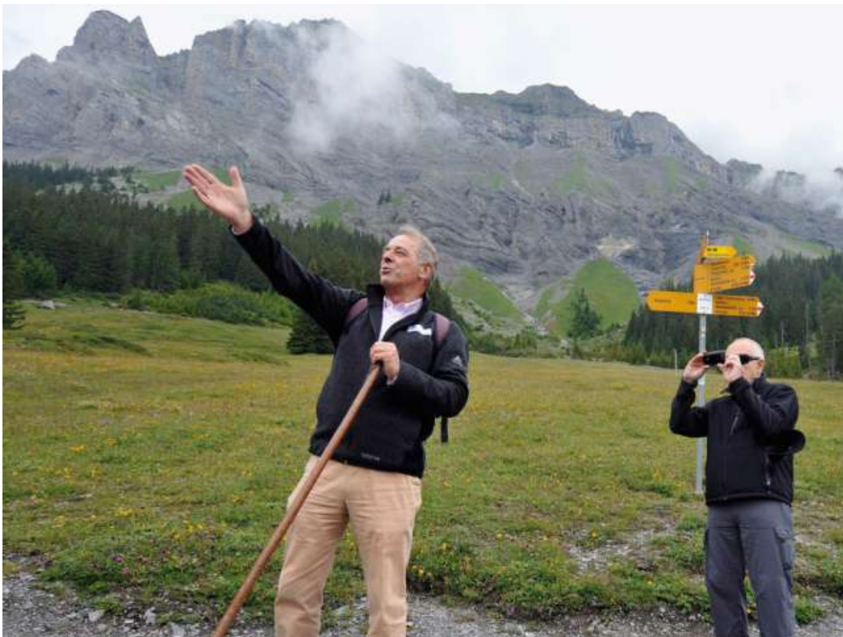
Alt Bundesrat Adolf Ogi ist als naturverbunden bekannt. Am Dienstag, 18. Juli, feiert Ogi seinen 75. Geburtstag.

Vater des Jahrhundert-Bauwerks NEAT, Eierkocher der Nation, volksnaher Landesvater, weltoffener Politiker und treues SVP-Mitglied: Adolf Ogi hat viele Facetten. Am heutigen Dienstag feiert der ehemalige Bundesrat aus Kandersteg seinen 75. Geburtstag.